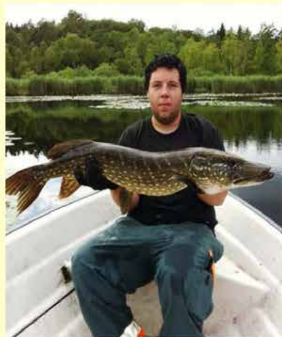
Gädda på 13 kg, tagen i Bälingsjön