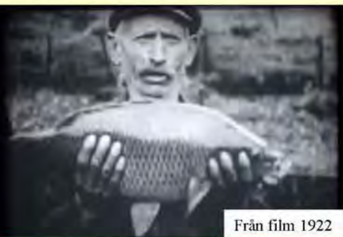
Från film 1922

Tolv milstenar, två gästgiveristenar, två vägvisarstenar, tolv väghållningsstenar och en gränssten utmed farbar väg (övriga gränsstenar ej nåbara med bil). Därtill tre ej funktionsbestämda stenar. Perstorp täcker en yta på 161,92 kvkm med c:a 7.200 invånare. Det betyder c:a 5 kvkm per sten eller c:a 230 invånare per sten. Perstorps Hembygdsförening håller på med, i samråd med länets miljöenhet, att renovera vägstenar i kommunen och sätta upp informationstavlor.